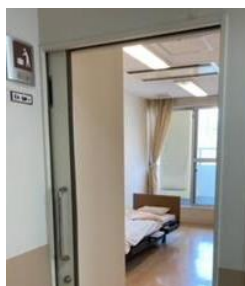
個室で広く清潔感がありますが、ベッドについての希望が多数ありました