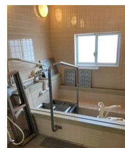
浴室については不安の声が多くありました